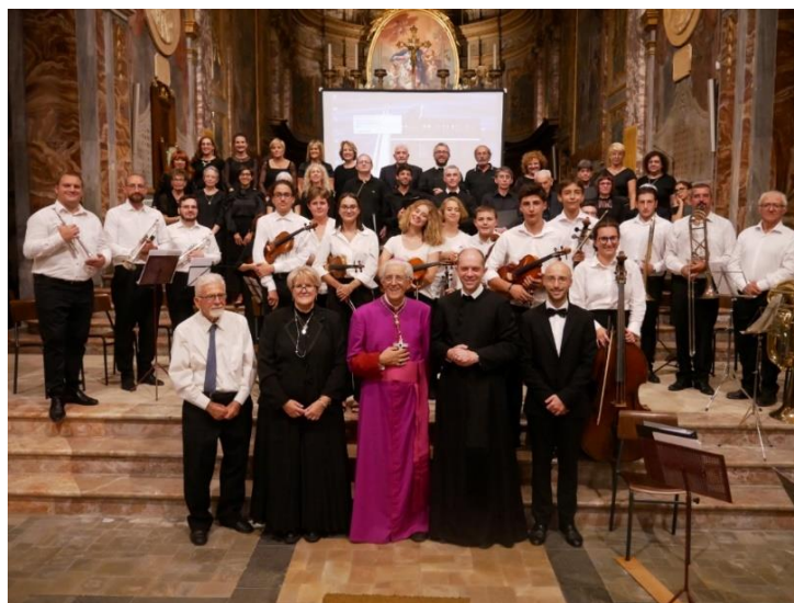
Cappella Musicale "Santa Maria Assunta" Cattedrale di Ivrea