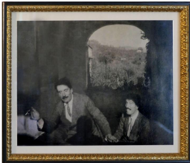
Giuseppe Giacosa e Giacomo Puccini