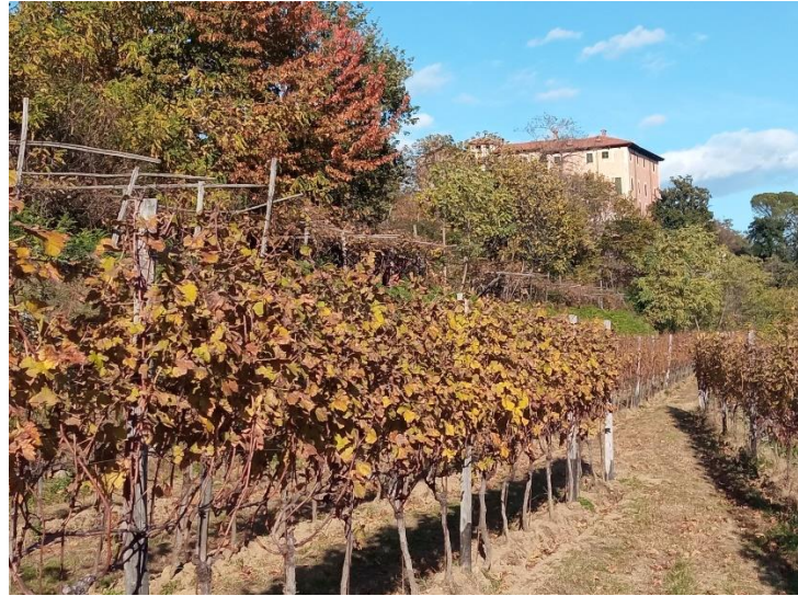
Il casotto di Vigna e la Vigna del Belvedere

Sabato 21 settembre 2024 ore 21, Villa Pasta, Via Parrocchia 15, Burolo HAUSMUSIK – CHANSONNIER FRANCESI