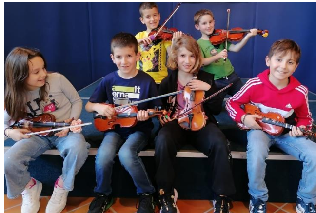
Giovani Allievi del Centro Suzuki del Canavese