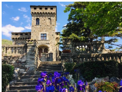
Il Castello di Montestrutto