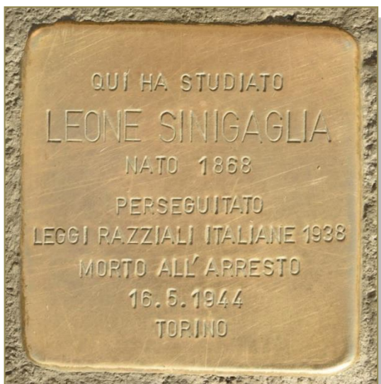
Pietra d'inciampo di Leone Sinigaglia in piazza Bodoni a Torino

Obiettivo della serata è restituire la voce a raffinati compositori la cui fortuna è stata condizionata dall'origine ebraica o la cui stessa vita è stata stroncata dalla persecuzione antisemita. Il torinese Leone Sinigaglia , anche grazie alla sua seria formazione viennese (che condivise in parte con l'inseparabile amico Rosario Scalerò ), fu all'inizio del Novecento un musicista di spicco internazionale, stimato da Arturo Toscanini e da Gustav Mahler. Braccato e scoperto dalla polizia nazifascista nel 1944, morì d'infarto al momento dell'arresto. Il fiorentino Mario Castelnuovo-Tedesco (1895-1968), grazie all'aiuto offertogli da Arturo Toscanini e Jascha Heifetz, nel 1939 emigrò negli Stati Uniti affermandosi come autore di colonne sonore per film. Il ceco Hans Kràsa (1899 - 1944) trascorse più di due anni internato nel campo di concentramento di Theresienstadt contribuendo all'attività culturale del ghetto. Memorabile è la rappresentazione della sua opera per bambini Brundibár , il 23 giugno 1944, alla presenza della delegazione internazionale della Croce Rossa, organizzata dai nazisti per ingannare l'opinione pubblica. Al trio d'archi dedica le sue ultime energie creative: la Passacaglia e Fuga è la sua ultima composizione, scritta prima di essere deportato e ucciso ad Auschwitz.